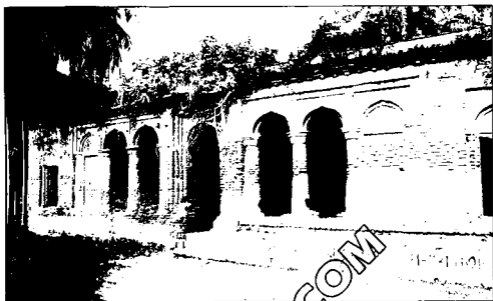
টুঙ্গিপাড়ায় আদি শৈখিক বাড়ি