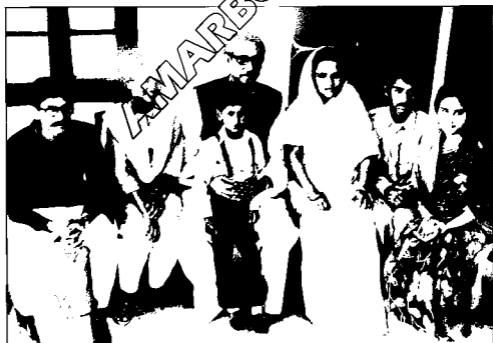
সপরিবারে লেখক। বামে স্ত্রী বেগম ফজিলাতুননেছা, শেখ জামাল ও শেখ হাসিনা। ডানে শেখ রেহানা, শেখ কামাল ও কোলে শেখ রাসেল, ১৯৭২