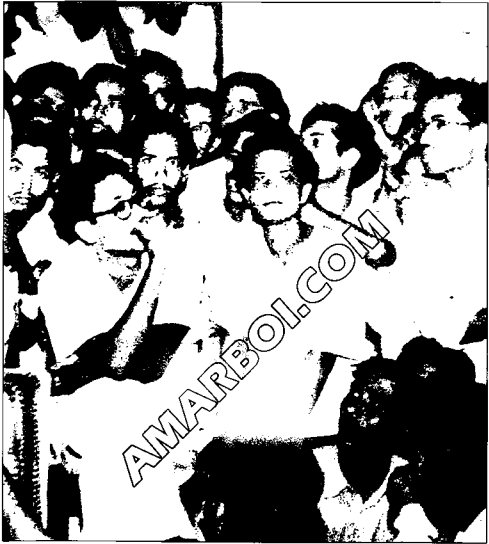
সহযোদ্ধাদের সঙ্গে পরামর্শকালে