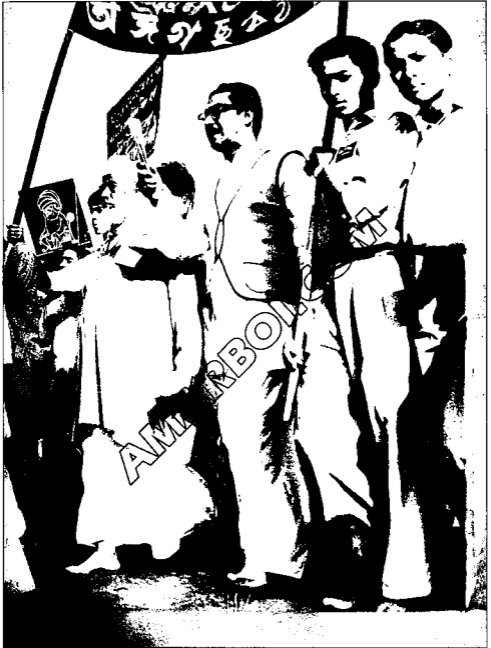
মওলানা ভাসানীসহ প্রভাতফেরিতে, ২১ ফেব্রুয়ারি ১৯৫৩